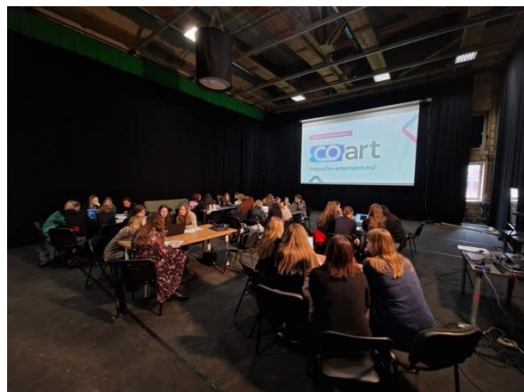
Izlaušanās istabu prezentācijas pasākums LKA Nacionālās filmu skolas telpās (16.03.2023., projekts "CO-ART")