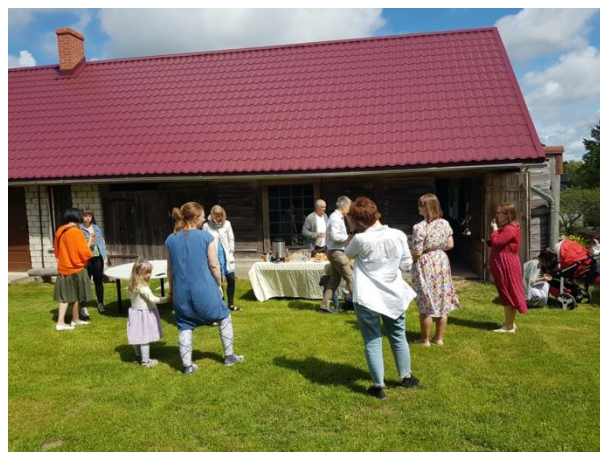
Pasākums Alsungā, Suitu klēti vietējiem aktīvistiem par sociālo uzņēmējdarbību kā labu rīku jauniešu uzņēmīguma veicināšanai (2022.gada jūnijs, projekts "INDIGISE")

Noteikti iesakām apmeklēt mūsu mājaslapu - tajā pieejama visplašākā informācija par mūsu aktivitātēm un arī pamatinformācija par sociālo inovāciju latviešu valodā. Ja tomēr rodas kāds konkrēts piedāvājums,