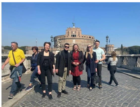
Dalība debatēs Romā par cilvēktiesību jautājumiem un Pamattiesību hartu (2022.gada marts, projekts "NICE")

Šī izstāde tika radīta projektā, kas tika ieplānots par godu šīs hartas desmitajai gadadienai, taču Covid ietekmē tas tika atcelts un spējām to realizēt vairākus gadus vēlāk. Kopumā tajā iespējams redzēt jauniešu interpretāciju par to, kā viņi saredz savas brīvības un tiesības, kuras kā